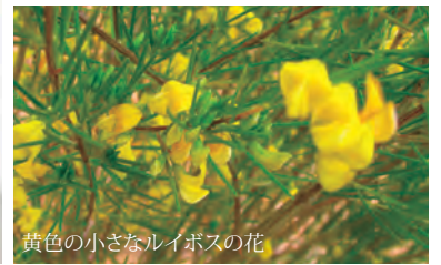
黄色の小さなルイボスの花