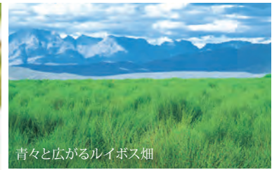
青々と広がるルイボス畑